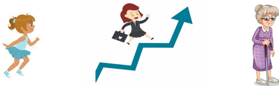
ЧИСЛЕННОСТЬ ЖЕНЩИН ПО ОТДЕЛЬНЫМ ВОЗРАСТНЫМ ГРУППАМ В СТАВРОПОЛЬСКОМ КРАЕ НА 1 ЯНВАРЯ 2020 ГОДА